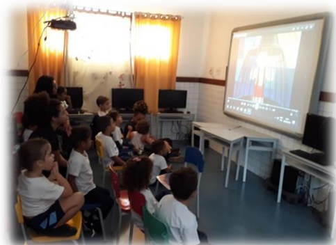
Turma do Grupamento III assistindo o filme João e Maria