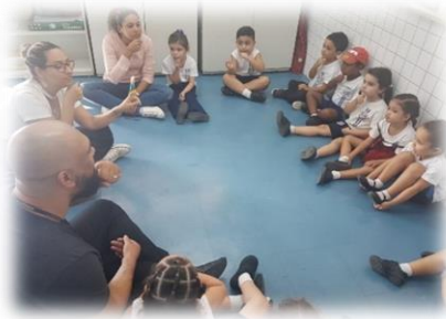
Turma 32 fazendo o sinal de vovó