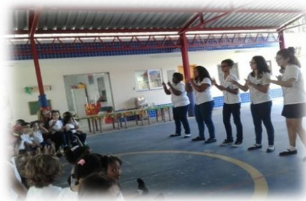
Coral de Libras de São Cristóvão

No último dia de visita, o CREIR recebeu o Coral de Libras de São Cristóvão que trouxe composições que já faziam parte do repertório musical do CREIR, mas com tradução para Libras adaptada à faixa etária.