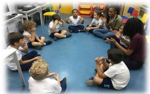
Oficina de Estimulação da Linguagem Oral e funções executivas

O NAPNE do CREIR oferece duas oficinas diante das necessidades observadas na Educação Infantil: Estimulação da Linguagem Oral e Funções Executivas; e Vivências Psicomotoras. A Oficina de Estimulação da Linguagem Oral e Funções Executivas visa desenvolver aspectos da fala, atenção, audição e memória por meio de diferentes experiências. A