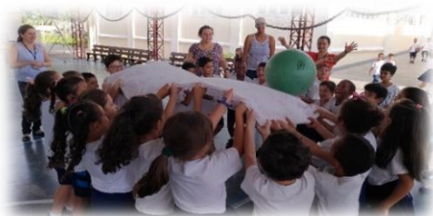
Jogo colaborativo com a equipe de Educação Física

uma atividade de integração das crianças do Grupamento V e 1º ano. Nesse dia, as crianças assistiram o vídeo "Cordas", conversaram a respeito e participaram de um jogo colaborativo elaborado por ambos os Núcleos em parceria com a equipe de Educação Física.