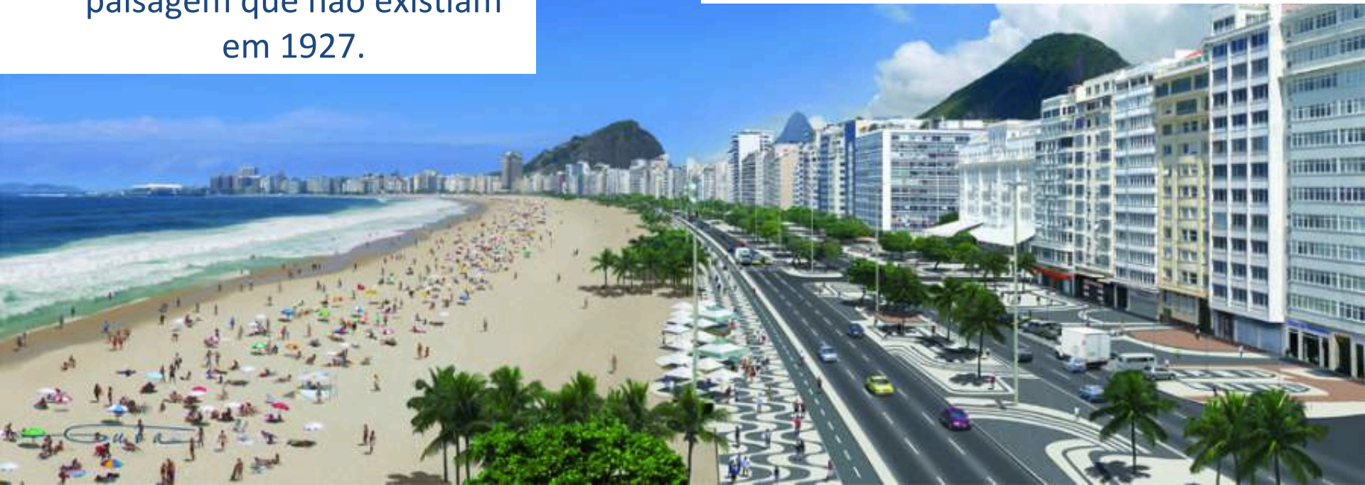
Figura B: Orla de Copacabana em 2007.

❖ JOGO DOS 7 ERROS: Circule, na figura B, 7 elementos da paisagem que não existiam em 1927.