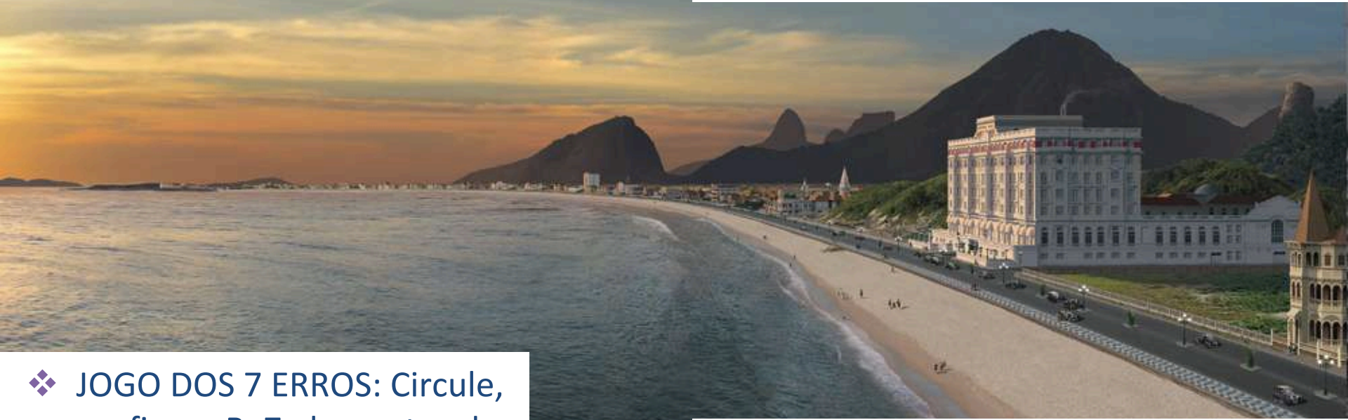
Figura A: Orla de Copacabana em 1927.

❖ JOGO DOS 7 ERROS: Circule, na figura B, 7 elementos da paisagem que não existiam em 1927.