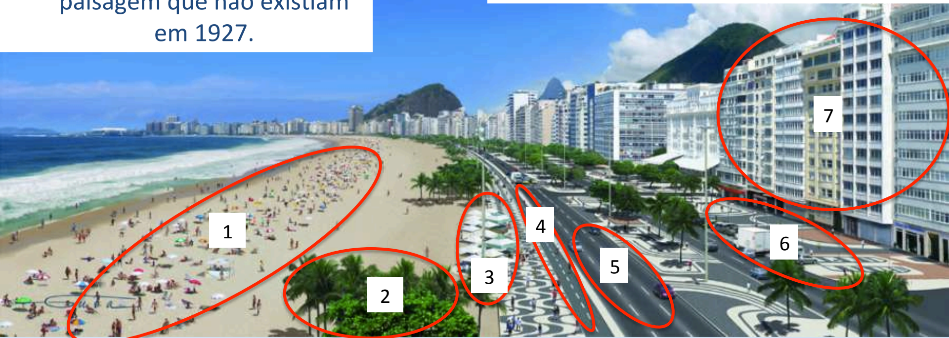
Figura B: Orla de Copacabana em 2007.

❖ JOGO DOS 7 ERROS: Circule, na figura B, 7 elementos da paisagem que não existiam em 1927.