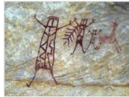
Pinturas rupestres na Serra da Capivara, no Piauí

https://sites.google.com/site/cp2arteindigena/arte-rupestre