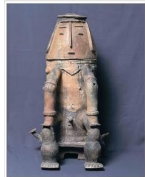
Urna Maracá em que aparece claramente um índio sentado em seu banquinho.

No estado do Amapá, por volta do ano 1.000, criaram vários estilos de cerâmica. Esse tipo de urna é usado por indígenas da Guiana. Suas principais características são: cilíndricas, zoomorfas ou antropomorfas; Tem indivíduos em bancos com as mãos apoiadas nos joelhos; As figuras tinham formas bem estilizadas.