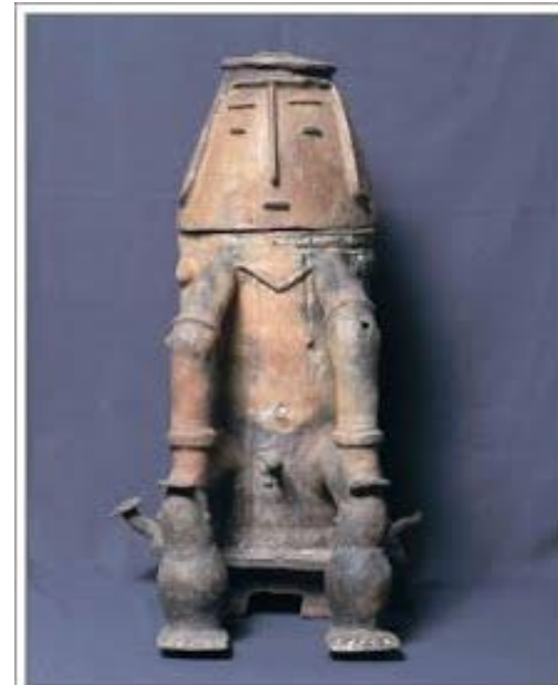
Urna Maracá em que aparece claramente um índio sentado em seu banquinho.

As urnas funerárias da cultura maracá se destacam. Seus sítios arqueológicos são grutas, onde foram encontradas urnas funerárias. Esse tipo de urna ainda é usado por alguns grupos. Suas características são: cilíndricas, zoomorfas ou antropomorfas, apresentam pessoas sentadas com as mãos apoiadas nos joelhos, tinham figuras com formas bastante estilizadas.