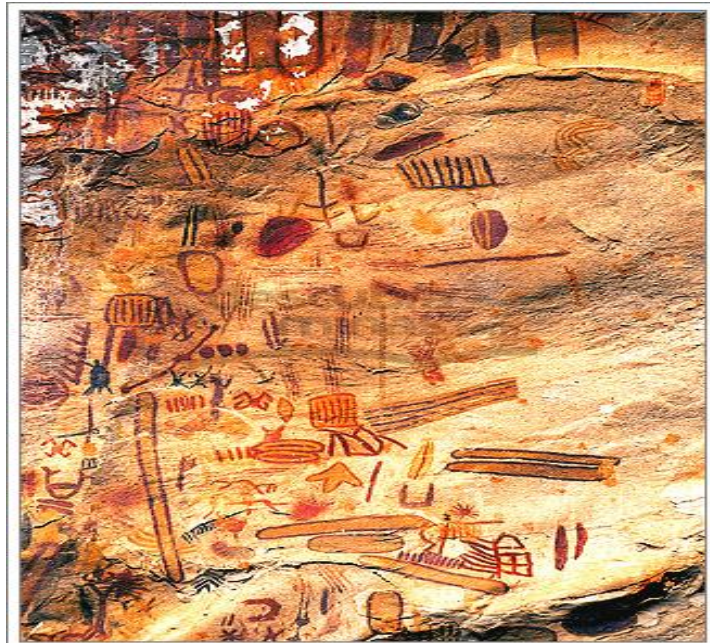
Parque Nacional Cavernas do Peruaçu.