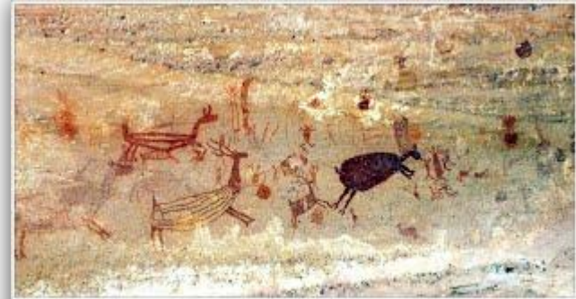
Pinturas rupestres na Serra da Capivara, no Piauí

Os desenhos representavam seu cotidiano, pensamentos, etc (desenhos como: caça, pesca, etc). As cores mais usadas são vermelho e preto.