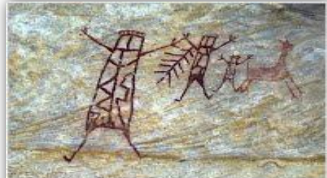
Pinturas rupestres na Serra da Capivara, no Piauí

https://sites.google.com/site/cp2arteindigena/pintura-corporal