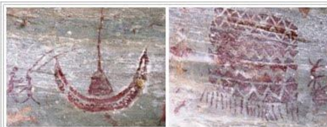
Sítio arqueológico Casa Santa, em Carnaúba dos Dantas, no Rio Grande do Norte.