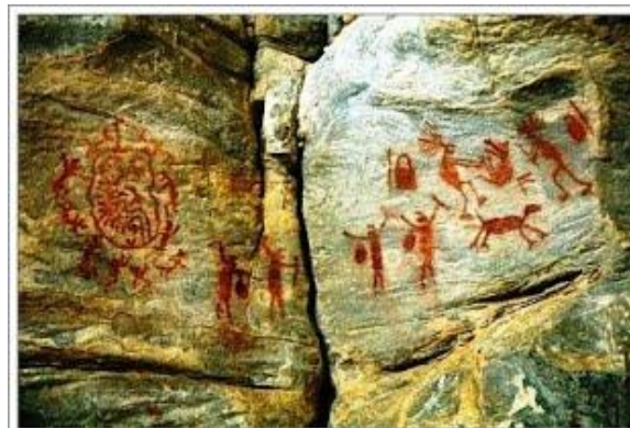
Sítio arqueológico Xiquexique I, em Carnaúba dos Dantas, no Rio Grande do Norte.

A subtradição Seridó é encontrada na região do Seridó, no Rio Grande do Norte. Quem fez essas imagens foram os povos nômades que habitavam neste local naquela época. As pinturas representavam pirogas, figuras humanas que pareciam carregar cestas, bolsas e figuras humanas com a boca aberta parecendo cantar ou gritar.