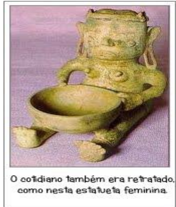
O cotidiano também era retratado, como nesta estatueta feminina.